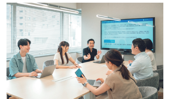
【写真上】エントランスからも明るく広々としたオフィスの様子が一目瞭然。